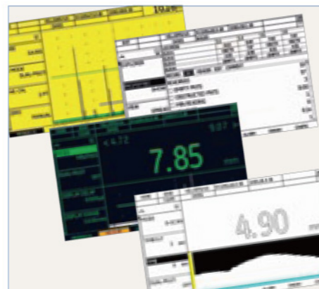
适合每个人的视图：大型 A 扫描、数据记录器、厚度、B 扫描。