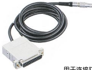
用于连接打印机和 电脑的串行数据电缆