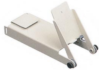
支持及定位装置 MIC 1040