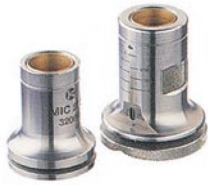
平面附件MIC 270 棱形附件MIC 271