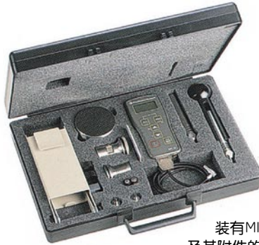
装有MIC 10 及其附件的提箱