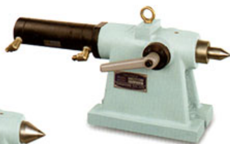
HTTS-油壓尾座系列 PTTS-氣壓尾座系列 (另有短缸規格)