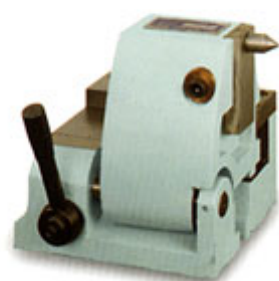
MTS-尾座系列 (側邊旋轉)