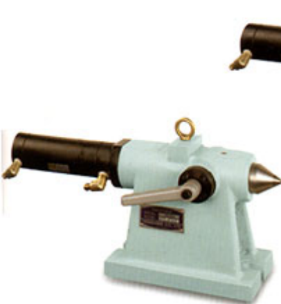
HTS-油壓尾座系列 PTS-氣壓尾座系列 (另有短缸規格)