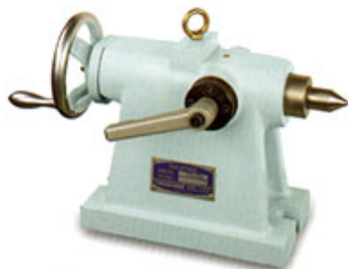
TTS-尾座系列 (可更換式測針)