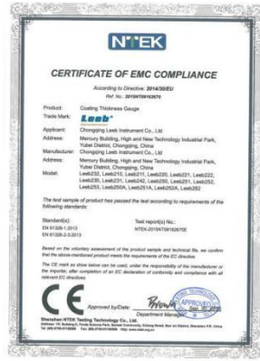
欧盟 CE 认证