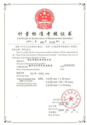
计量标准考核证书