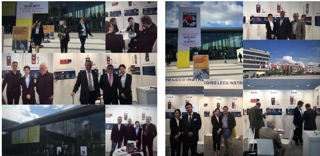
2017 德国斯图加特国际质量控制与仪器仪表展（如上图）