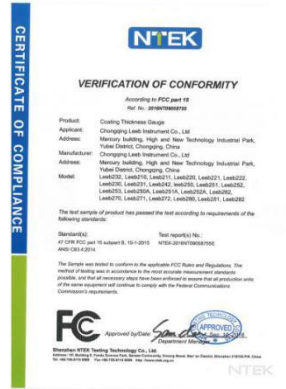
美国 FCC 认证