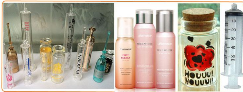
LH-300 三工位全自动丝印机